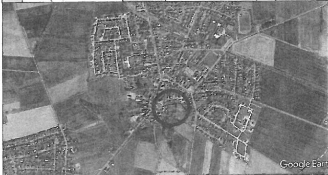
Das Plangebiet befindet sich im Süden der bebauten Ortslage Rühren, wie dargestellt.

Vermessungsbüro Wolfsburg Stein & Stroot Schillerstraße 62 38440 Wolfsburg Tel. 05361/27880 Fax 05361/25264